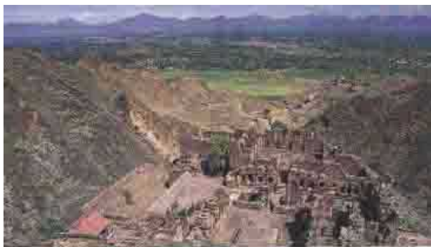
Ruinas budistas en Takht-Bahi - Paquistán